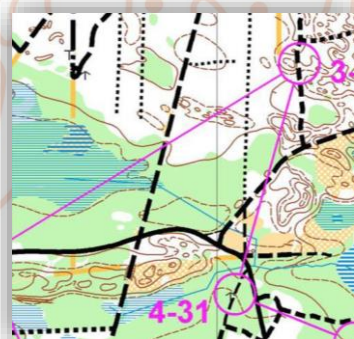
Specjalistyczna mapa do RjNo